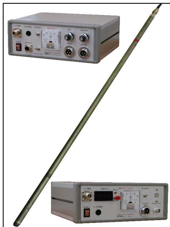
鉛直磁気探査機器一式