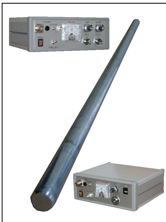
水平磁気探査機器一式